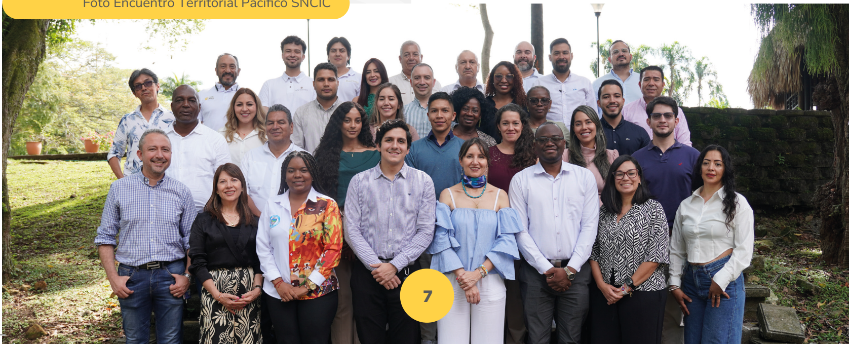
Foto Encuentro Territorial Pacífico SNCIC