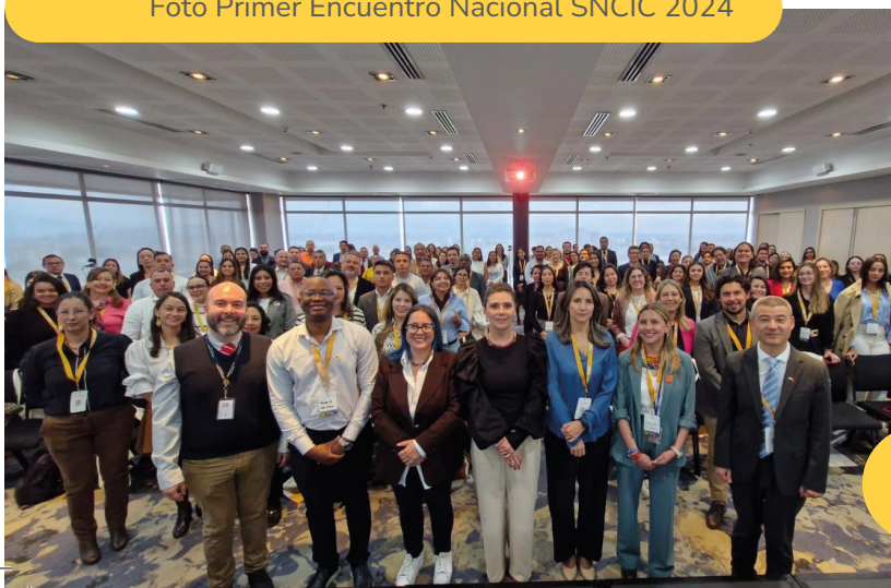
Foto Primer Encuentro Nacional SNCIC 2024

A continuación, queremos compartir con los actores del ecosistema de la cooperación, por considerarlo de gran utilidad para los procesos de gestión, un breve resumen con información sobre los 4 Encuentros Territoriales (regiones Caribe, Pacífico, Amazonia y Central) que realizamos durante 2025, y que se constituyeron en plataformas clave para afianzar el diálogo, orientar la gestión y fortalecer la confianza, bajo los pilares de una cooperación descentralizada, horizontal, inclusiva y transformadora, y que han contribuido a la sostenibilidad, el desarrollo territorial y la construcción de paz en Colombia.