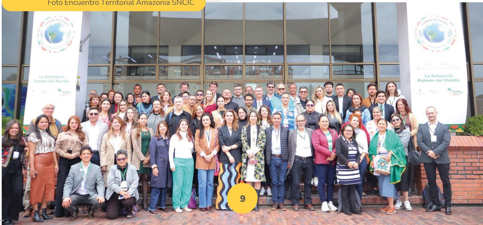
Foto Encuentro Territorial Amazonia SNCIC