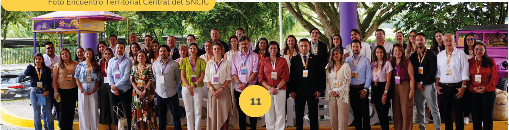
Foto Encuentro Territorial Central del SNCIC