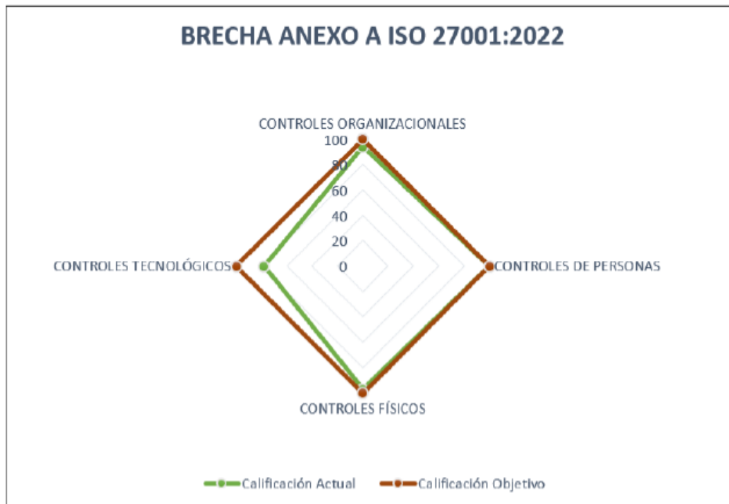
Ilustración 1 Análisis de Brechas SGSPI