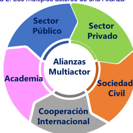
Figura 2. Los múltiples actores de una Alianza

Los actores que pueden intervenir en el desarrollo de Alianzas Multiactor son diversos. Por tanto, APC-Colombia ha agrupado a los actores en los siguientes sectores: i. Sector Público; ii. Sector Privado; iii. Sector de la Sociedad Civil; iv. Sector de la Cooperación Internacional; y, v. Sector de la Academia.